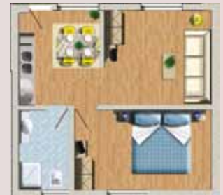
Bungalow Deluxe 2-4 Pers.